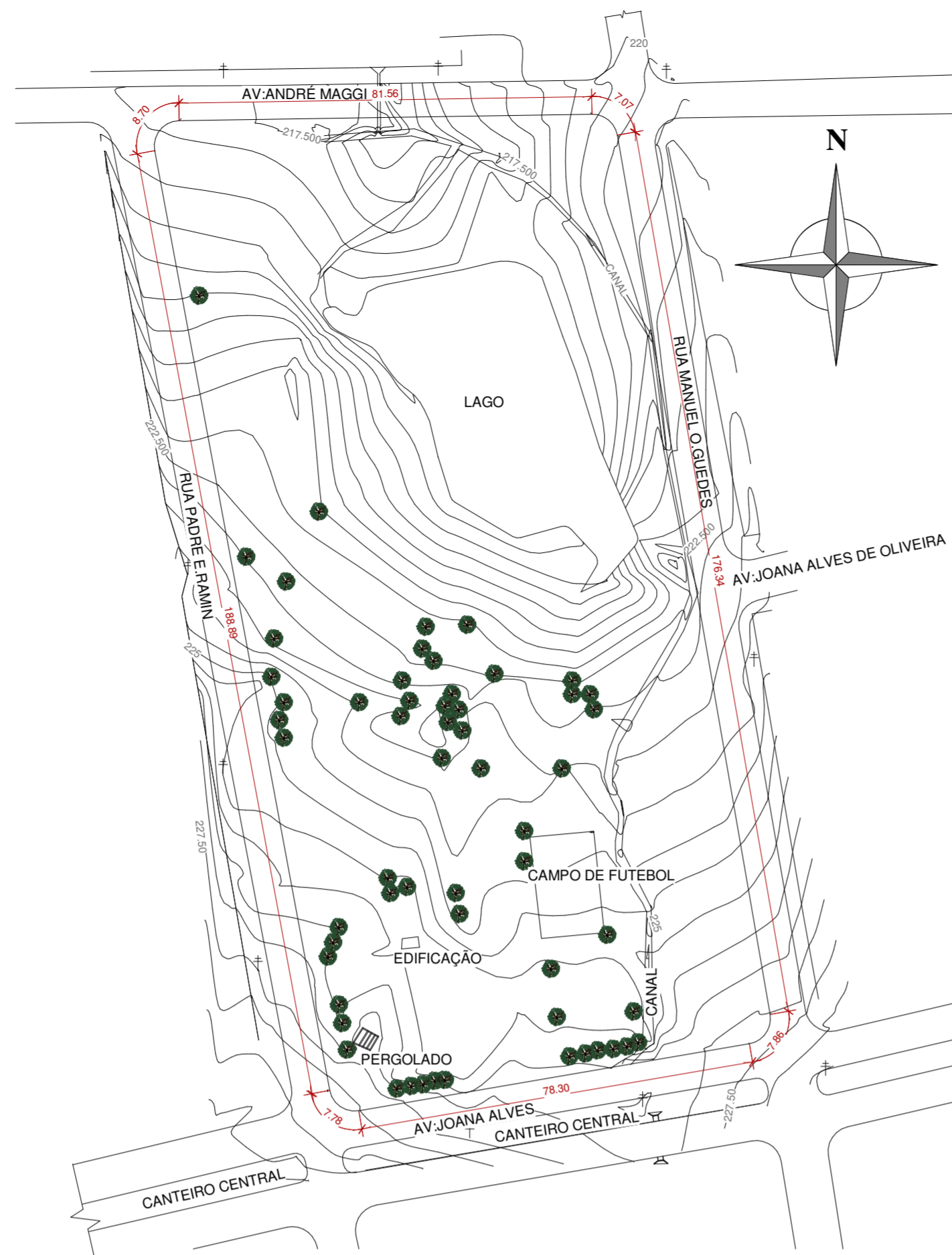
2 SITUAÇÃO 1 : 1000