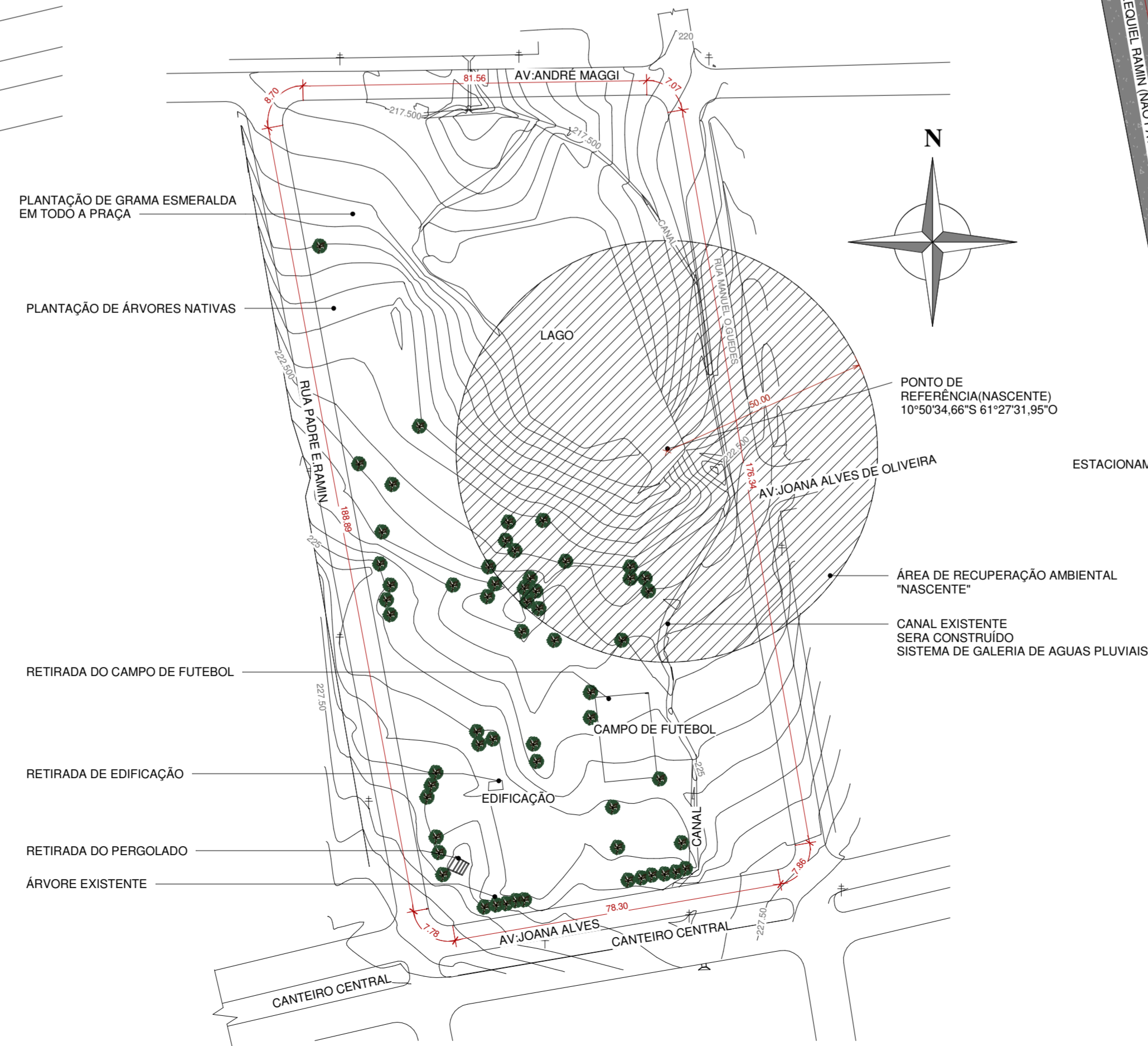
3 PLANTA DE INTERVENÇÃO 1 : 1000