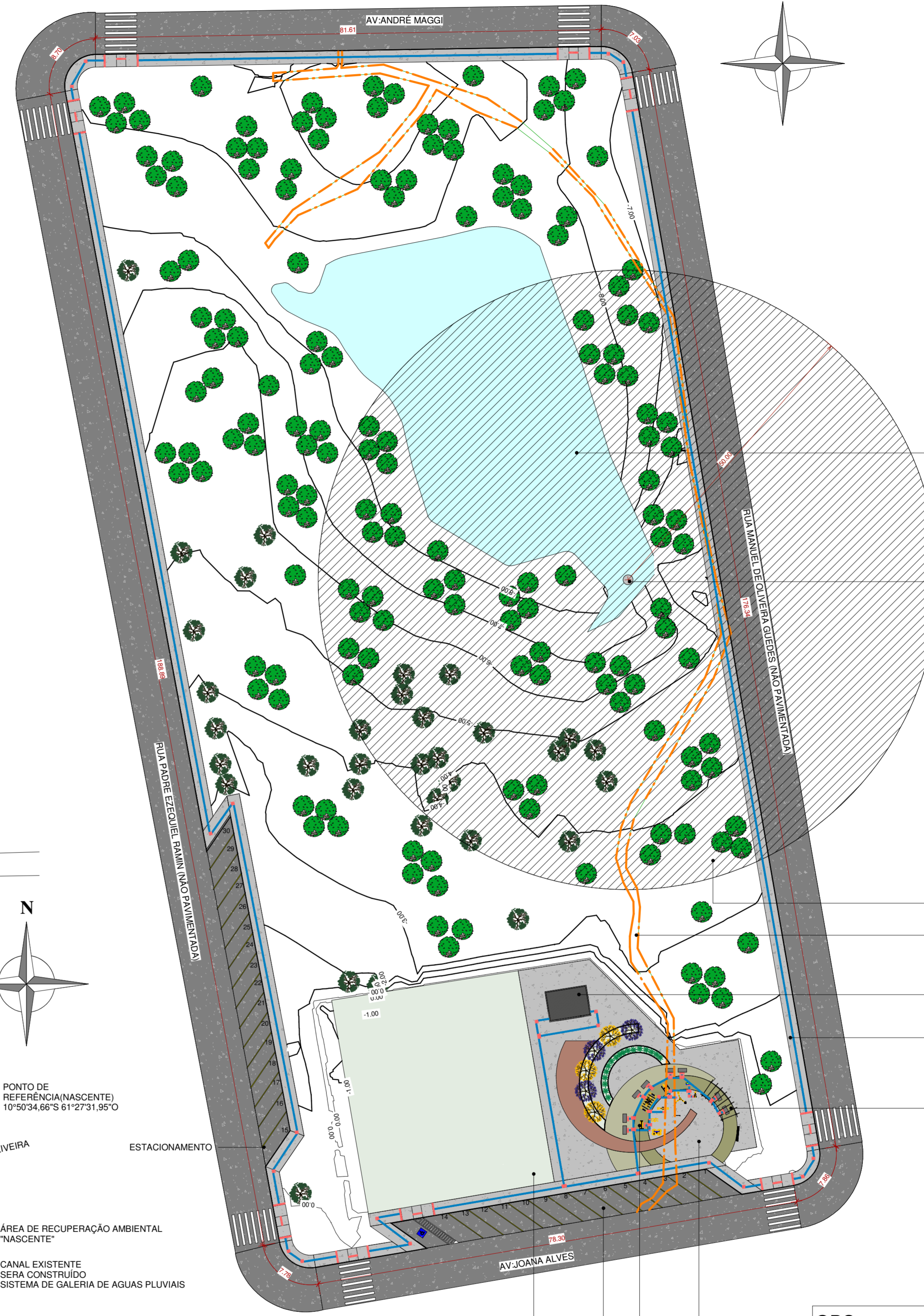
1 0.11 -IMPLANTAÇÃO/PLANIALTIMÉTRICO 1 : 500